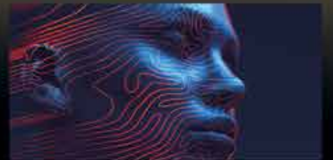
2025 teknolojiye yapay zeka devrimine sahne olacak